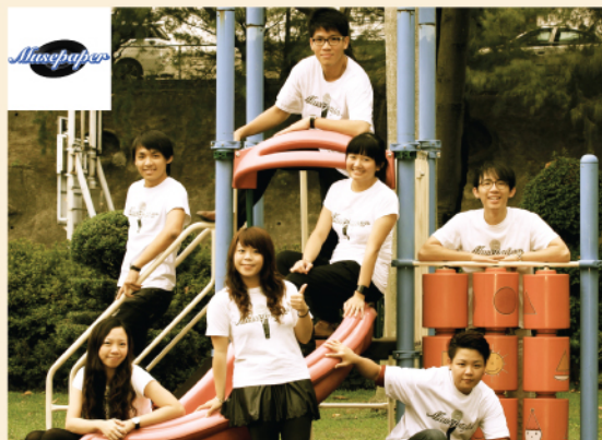
阿卡贝拉专场——妙声之旅