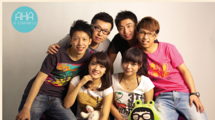
阿卡贝拉专场——声靡夏日