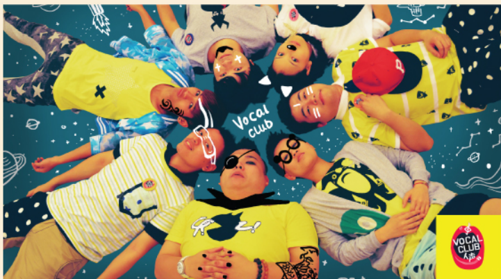
阿卡贝拉专场——粤谐人声