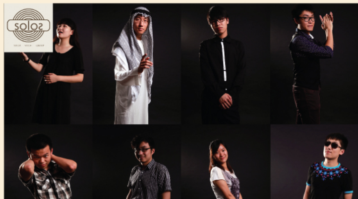
阿卡贝拉专场——声声不息

来自瑞典Club for Five的重新编曲演绎，细腻、动感、轻巧的编曲却不失和声的厚重，讲述一个深沉的道理。