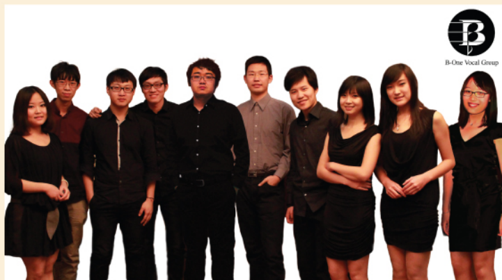
阿卡贝拉专场——音乐小巴